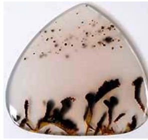
Montana-Achat- Cabachon, USA